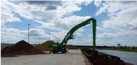
Hafen Wustermark „HavelPort“

Das Land Brandenburg ist das wasserreichste Bundesland und besitzt ein dichtes leistungsfähiges Wasserstraßennetz mit einer Vielzahl von Binnenhäfen, das auch für die Güterschifffahrt noch stärker genutzt werden soll.